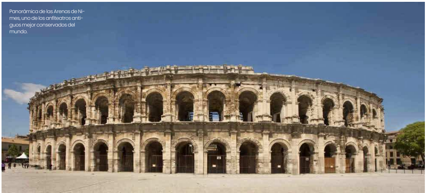
Panorámica de las Arenas de Nimes, uno de los anfiteatros antiguos mejor conservados del mundo.

Distribuido para HARMON -- OUIGO * Este artículo no puede distribuirse sin el consentimiento expreso del dueño de los derechos de autor.