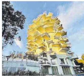
El Árbol Blanco de Montpellier.