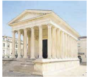
La Maison Carrée de Nimes.